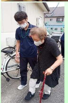
手の実践練習や屋外での実践練習