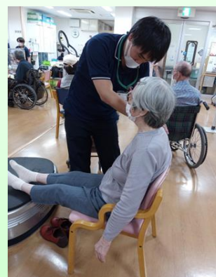
トレーニング指導や療法士監修による集団体操