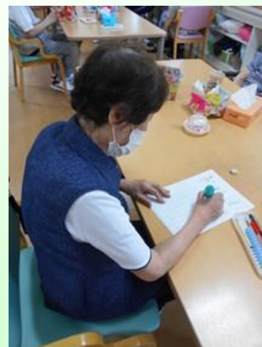
専門職との手の練習