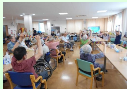
専門職による集団や個別での運動指導